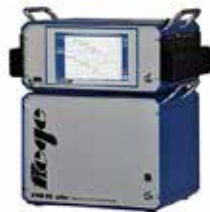
Nadelverschluss-Steuerung Alles in einem Werkzeugdatensatz