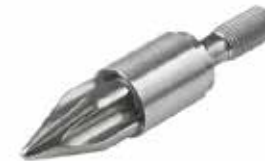
Rückstromsperren klassisch 3-teilig oder in Sonderausführungen