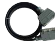
Werkzeuganschlusskabel Heizungs-, Fühler und Kombikabel