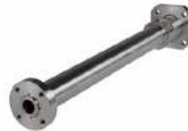
Bimetall-Zylinder hochverschleißfest für abrasive und korrosive Anwendungen