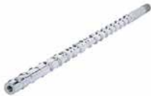
Plastifizierschnecken Standard- und Sondergeometrien