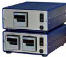
JETmicro Klein, universell, intuitiv