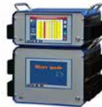
TP-Baureihe | fitron TP Einfach in der Bedienung